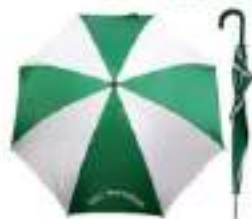
Regenschirm 10,00 €