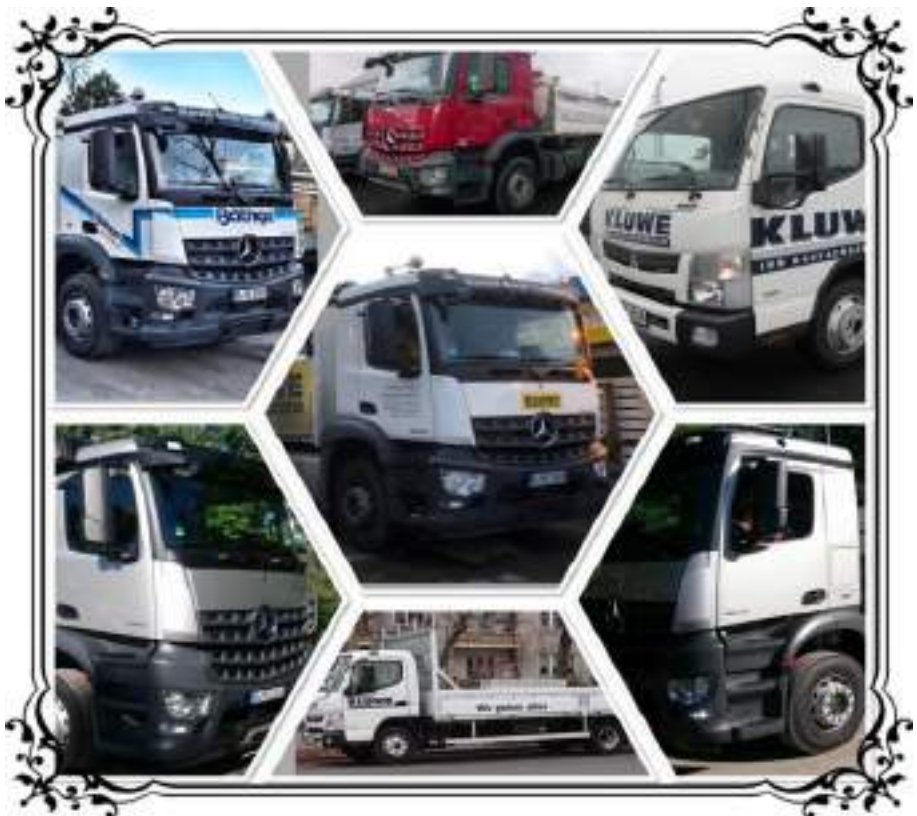
Harald Bahrt Transporte Epensteinstraße 17, 13409 Berlin