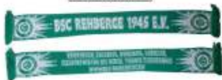
Bechel 10,00 €